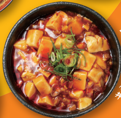
四川風麻婆豆腐丼