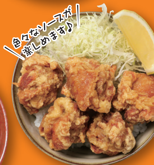
色んなソースが 楽しめます♪