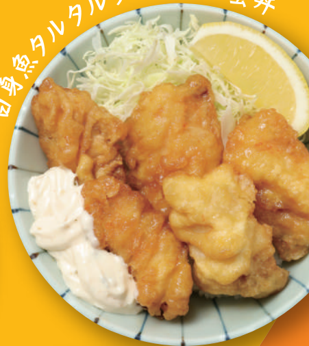
白身魚タルタルソースの南蛮丼