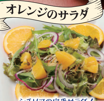
オレンジのサラダ

トマトと魚介の旨みがギュッと凝縮! 魚介のエキスがたっぷり染み込んだスープが、 食欲をそそります。