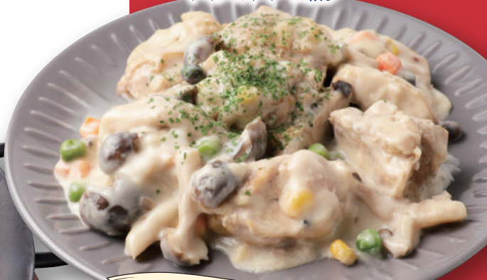
鶏肉のフリカッセー