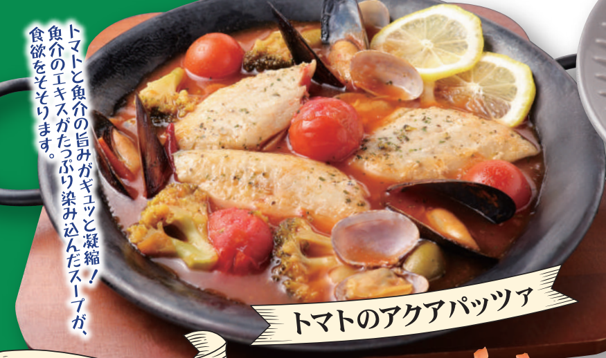
トマトのアクアパッツァ

トマトと魚介の旨みがギュッと凝縮! 魚介のエキスがたっぷり染み込んだスープが、 食欲をそそります。